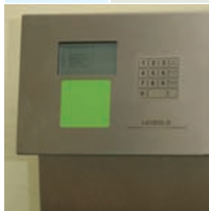
Tankautomat für Transponder