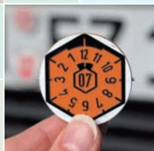
Software Werkstatt- Management-System