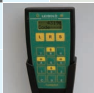
Funkpilot für automatische Identifizierung